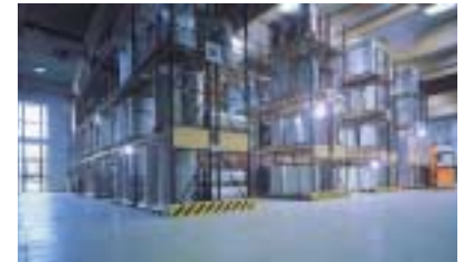
Bild unten links: Die neue Haftbeschichtungsanlage, die im 2. Quartal voll produziert wird. Oben: Ausreichende Lagerkapazitäten am Standort Bückeberg.

Am Stammsitz in Bückeberg ist zudem die neue Fertigwarenhalle mit ca. 400 qm fertiggestellt worden, in die in den ersten drei Monaten Berger Textilien verlagert wurden. Die Produktion